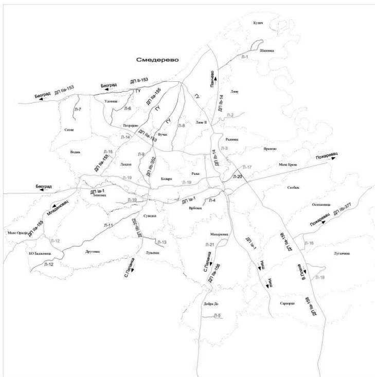
Прегледна карта локалних путева Града Смедерева по приоритетима одржавања зимске службе

УКУПНО I + II + III 92,40 +7,44 =99,84 км